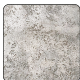
ШТУКАТУРКИ НА ЦЕМЕНТНОЙ ОСНОВЕ