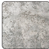
ШТУКАТУРКИ НА ЦЕМЕНТНОЙ ОСНОВЕ