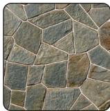
ПРИРОДНОГО И ИСКУССТВЕННОГО КАМНЯ