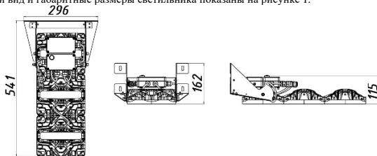
Рисунок 1 Общий вид светильника «L-pixel 3 Em banner» Поворотное крепление

1.7 Общий вид и габаритные размеры светильника показаны на рисунке 1.