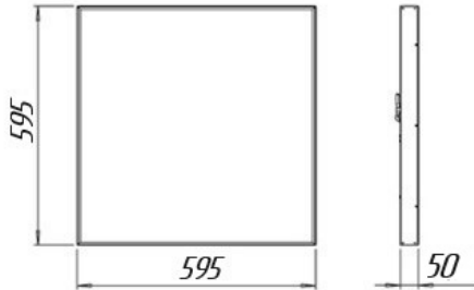
Рисунок 1. Светильник CCB 2.0 Base

2.5 Общий вид и габаритные размеры светильника показаны на рисунке 1.