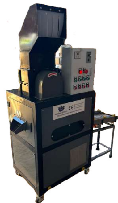
Станки для разделки кабеля Дробилка/Гранулятор/Сепаратор для кабеля MGS-50

Перед использованием станка внимательно прочитайте данное руководство, содержащее важные правила техники безопасности и инструкции по установке, эксплуатации, уходу и ремонту станка. Обеспечьте, чтобы руководство было в распоряжении для всех ответственных лиц.