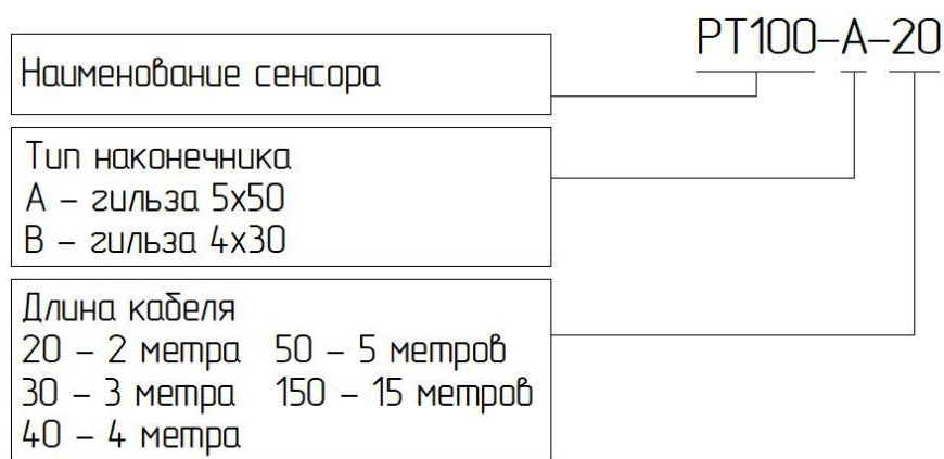
Рисунок А.1 – Структурная схема