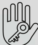
TTLock для IOS и Android