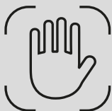
распознавание вен ладони