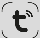
приложение TUYA WI-FI