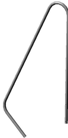
* Поручень (артикул: 050206)