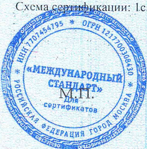
Схема сертификации: Iс.