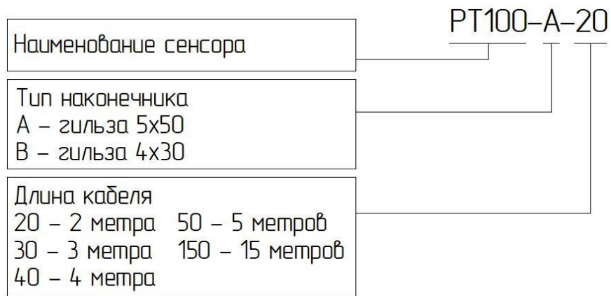
Рисунок А.1 – Структурная схема