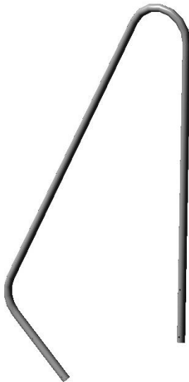
*Поручень (артикул: 050206)