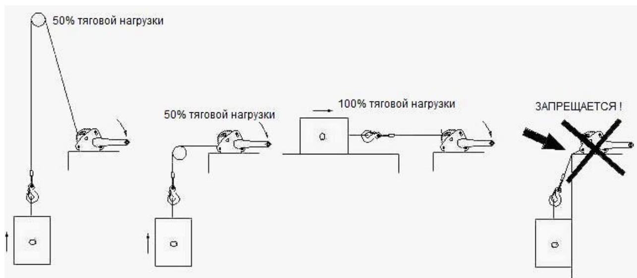
Рисунок 1. Принцип работы лебедки.

Ручная лебедка состоит из тросового барабана, редуктора подъема, рукоятки, корпуса (рамы), несущего узлы лебедки, стального троса или ленты и крюковой подвески. Лебедка управляется вручную с помощью рукоятки, которой совершают круговое движение. Лебедка имеет стопорный храповый механизм, предотвращающий самопроизвольное опускание поднятого груза. Если поднимаемый груз и лебедка расположены на одном уровне, то для подъема груза лебедку необходимо доукомплектовать блоком, который крепится сверху над грузом. Рисунок 1