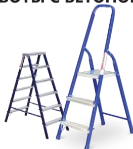
ЛЕСТНИЦЫ И СТРЕМЯНКИ