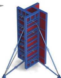
ОПАЛУБКА ПЕРЕКРЫТИЙ И СТЕН