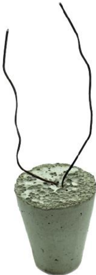
Бетонный фиксатор арматуры "Конус с проволокой"