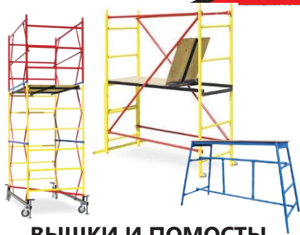
ВЫШКИ И ПОМОСТЫ