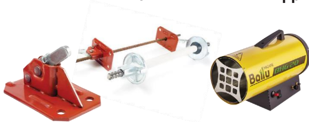
КОМПЛЕКТУЮЩИЕ К ОПАЛУБКЕ