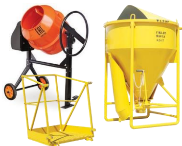
ОБОРУДОВАНИЕ ДЛЯ РАБОТЫ С БЕТОНОМ