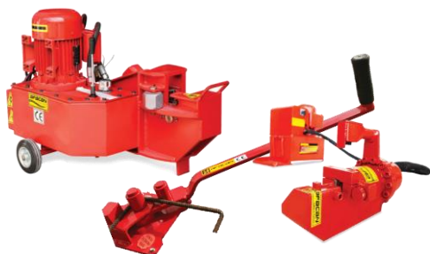
СТАНКИ ДЛЯ ГИБКИ И РЕЗКИ АРМАТУРЫ