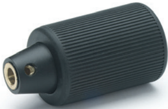
ELESA Original design

Покрытие с эластомером "soft-touch" улучшает захват даже при наличии жира, смазки и влаги на руках. По этой причине оно подходит для тренажеров, инструментов и машин для садоводства и грузовых перевозок, высокоточных инструментов и вспомогательных средств для лиц с ограниченными возможностями.