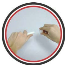
Надеть пластиковую гильзу