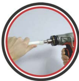
Вставить инструмент и расширить трубу вместе с гильзой