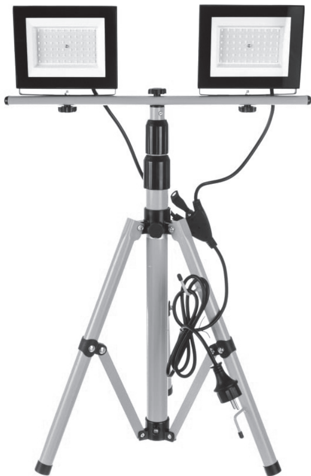
Рис. 1 Внешний вид