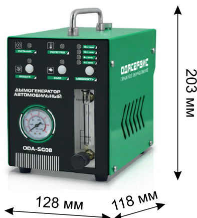
Рис.2 Общий вид дымогенератора