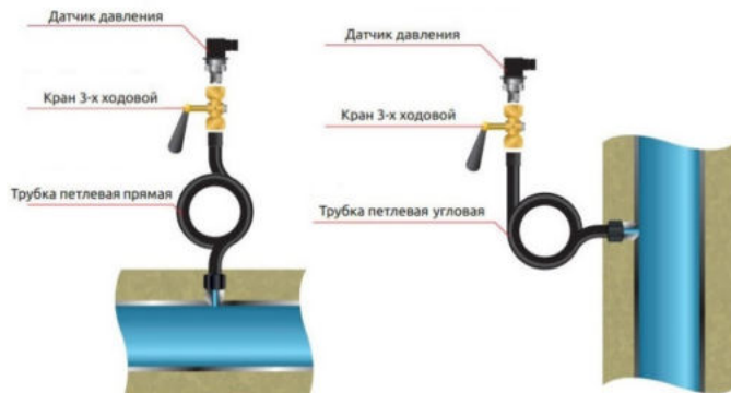
Рисунок 2 – Варианты монтажа на объекте

Для обеспечения правильной работы преобразователя, следует при эксплуатации контролировать, чтобы входные отверстия на защитном колпачке преобразователя оставались чистыми.