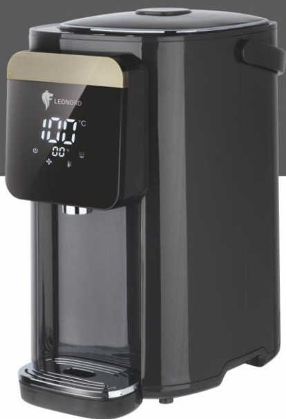
Термопот LE - 1541