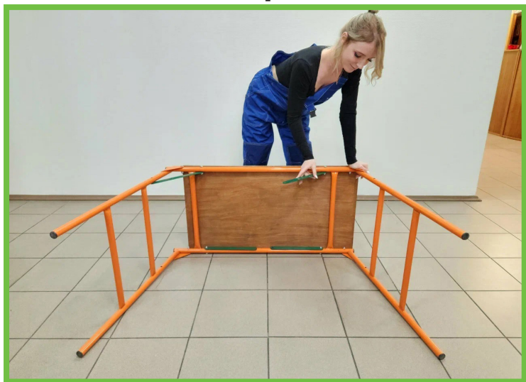
Быстро устанавливается и складывается