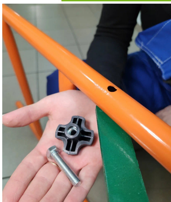
Укомплектован винтом с удобной гайкой «барашек»