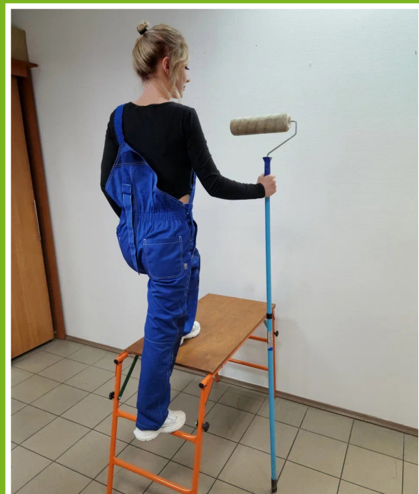
Удобные ступени для комфортного подъема