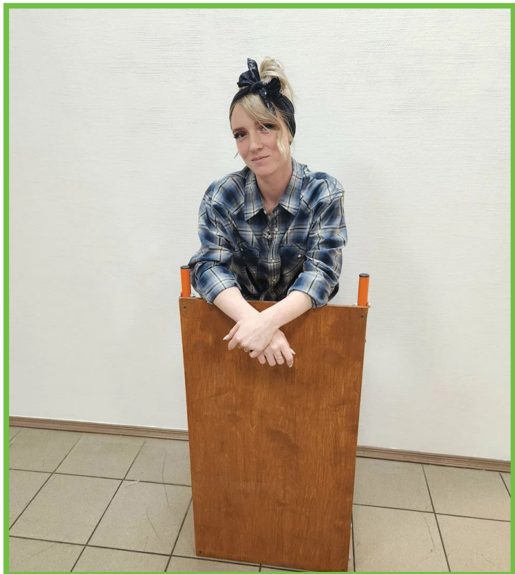
Столик компактно хранится и легко переносится