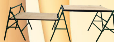
Строительный верстак — козлы «У-2»

Легкий, прочный, удобный в использовании, транспортировке и хранении.