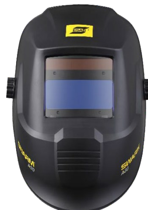
Легкий, обтекаемый корпус со светофильтром класса 1/1/1/2