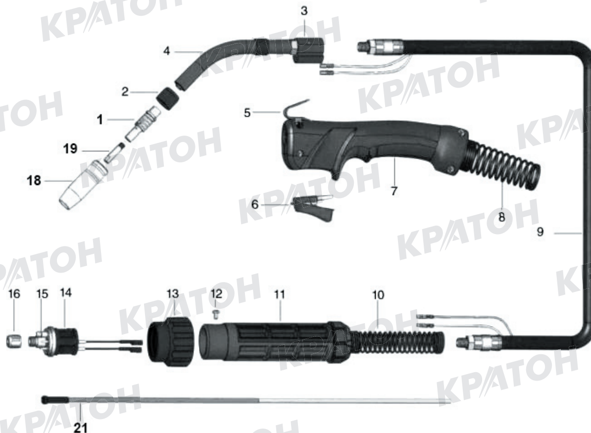
Схема сборки № 2