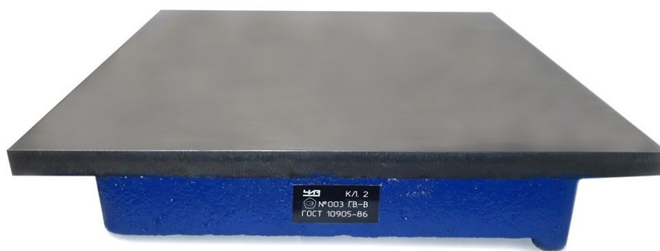
Рисунок 2 – Общий вид плиты поверочной и разметочной исполнения 2