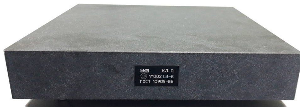
Рисунок 3 – Общий вид плиты поверочной и разметочной исполнения 3