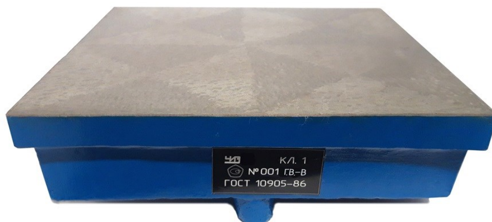
Рисунок 1 – Общий вид плиты поверочной и разметочной исполнения 1