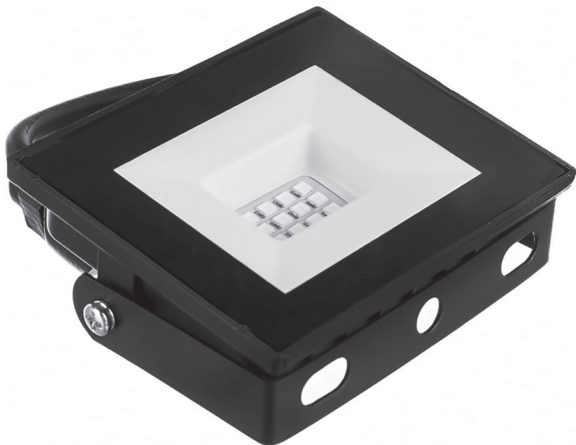
Рис. 1 Внешний вид