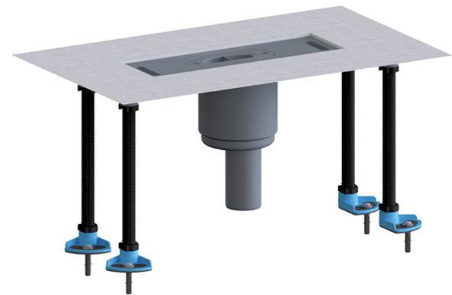
Душевой лоток HL53RVM/100