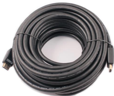
Рис.1 Кабели WH-111(15m), WH-111(20m), WH-111(25m), WH-111(30m), WH-111(35m), внешний вид.