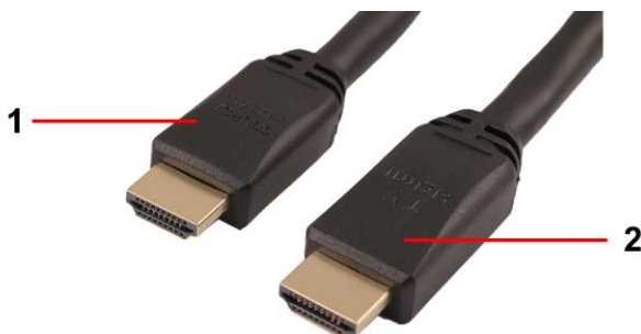
Рис.2 Разъемы кабелей WH-111(15m), WH-111(20m), WH-111(25m), WH-111(30m), WH-111(35m).