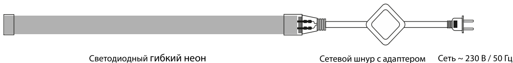
Схема подключения к сети питания

При сборке нанесенные на гибкий неон стрелки должны быть направлены от сетевого адаптера к концу гибкого неона. Для надежной фиксации и герметизации соединений перед установкой обработайте коннекторы, заглушки и сетевой шнур клеем-герметиком для ПВХ. Для обеспечения пылевлагозащиты и во избежание удара током на свободный край ленты обязательно следует установить заглушку. Перед включением в сеть убедитесь в правильном подключении контактов.