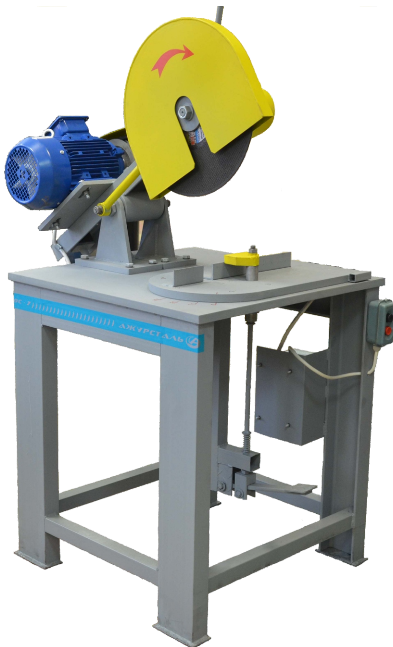
Общий вид изделия.

Для работы на оборудовании уровень подготовки персонала должен быть не ниже специального - технического.