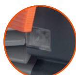
ПОДСВЕТКА РАБОЧЕЙ ЗОНЫ

СКОРОСТЬ - 5400 ОБ/МИН МАКСИМАЛЬНЫЙ ВНЕШНИЙ ДИАМЕТР ПИЛЬНЫХ ДИСКОВ - 165 ММ ПОСАДОЧНЫЙ ДИАМЕТР ПИЛЬНЫХ ДИСКОВ - 16 ММ ШПИНДЕЛЬ С КРЕПЛЕНИЕМ БОЛТОМ М6 ПОД ШЕСТИГРАННИК HEX5 МАКСИМАЛЬНАЯ ГЛУБИНА ПРОПИЛА В РАЗЛИЧНЫХ РЕЖИМАХ: 90° - 57 ММ / 45° - 37 ММ РАЗМЕР ПИЛЬНОГО ДИСКА: ВНЕШНИЙ / ПОСАДОЧНЫЙ / ТОЛЩИНА / КОЛ-ВО ЗУБЬЕВ - 65 / 16 / 1,2 / 24Т ММ ВЕС - 3,97 КГ