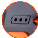
ИНДИКАТОР ЗАРЯДА АККУМУЛЯТОРА