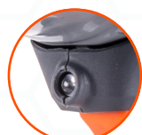
ПОДСВЕТКА РАБОЧЕЙ ЗОНЫ