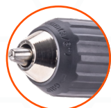
БЫСТРОЗАЖИМНОЙ ПЛАСТИКОВЫЙ ПАТРОН