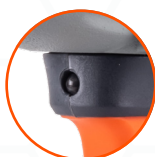
ПОДСВЕТКА РАБОЧЕЙ ЗОНЫ

[ «ТУШКА» БЕЗ АККУМУЛЯТОРА И ЗАРЯДНОЙ СТАНЦИИ ]