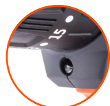
ПОДСВЕТКА РАБОЧЕЙ ЗОНЫ