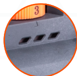
3-ЦВЕТНЫЙ ИНДИКАТОР ЗАРЯДА АККУМУЛЯТОРА

МАКС. ДИАМЕТР ДИСКА - 125 ММ КРЕПЛЕНИЕ ПОДОШВЫ К ИНСТРУМЕНТУ - М6 СО ШЛЯПКОЙ HEX5 КРЕПЛЕНИЕ НАСАДКИ К ПОДОШВЕ - М4 СО ШЛЯПКОЙ ПОД + ЧАСТОТА ВРАЩЕНИЯ ШПИНДЕЛЯ - 4000 - 10000 ОБ/МИН ВЕС - 2,32 КГ