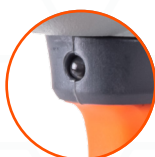
ПОДСВЕТКА РАБОЧЕЙ ЗОНЫ

[ «ТУШКА» БЕЗ АККУМУЛЯТОРА И ЗАРЯДНОЙ СТАНЦИИ ]