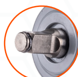
КРУТЯЩИЙ МОМЕНТ 900 НМ НА ОТКРУЧИВАНИЕ ПРИ РЕВЕРСЕ