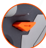
РЕВЕРС С ДОПОЛНИТЕЛЬНЫМ РЕЖИМОМ АВР ДЛЯ ЗАЩИТЫ БОЛТОВ ОТ ВЫПАДЕНИЯ ПРИ ОТКРУЧИВАНИИ