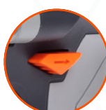
РЕВЕРС С ДОПОЛНИТЕЛЬНЫМ РЕЖИМОМ АВР ДЛЯ ЗАЩИТЫ БОЛТОВ ОТ ВЫПАДЕНИЯ ПРИ ОТКРУЧИВАНИИ