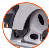
ДВУХКОМПОНЕНТНЫЙ ЗАЩИТНЫЙ КОЖУХ, С ПОДПРУЖИННЫМ НИЖНИМ СЕГМЕНТОМ