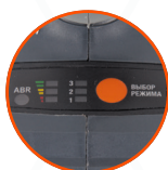
ИНДИКАТОР ЗАРЯДА АККУМУЛЯТОРА И РЕГУЛИРОВКА ОБОРОТОВ