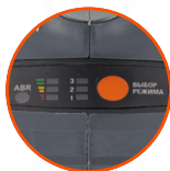
ИНДИКАТОР ЗАРЯДА АККУМУЛЯТОРА И РЕГУЛИРОВКА ОБОРОТОВ