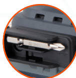
КРОНШТЕЙН ДЛЯ ОСНАСТКИ