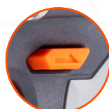
РЕВЕРС С ДОПОЛНИТЕЛЬНЫМ РЕЖИМОМ АВР ДЛЯ ЗАЩИТЫ БОЛТОВ ОТ ВЫПАДЕНИЯ ПРИ ОТКРУЧИВАНИИ