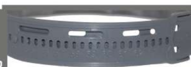
STANDART - размер 53-65 см (шаг 4 мм)

RAPID - нажать на регулировочную ручку, после путем вращения отрегулировать размер отпустить ручку (размер 51-65 см, шаг 2,5 мм) STANDART - ступенчатая регулировка размера, регулируется перестановкой ленты в пазы (размер 53-65 см, шаг 4 мм)