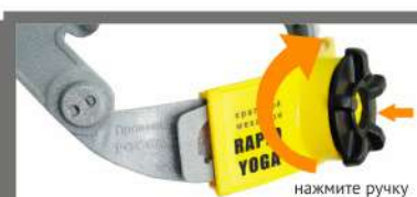
RAPID - размер 51-65 см (шаг 2,5 мм)