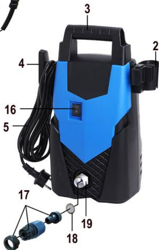
Рис. 1 Общий вид мойки

4.6. Система «Quick Connector» переходника подключения водоснабжения поз. 17 (входит в комплект поставки) позволяет осуществить легкое присоединение и отсоединение шланга водоснабжения (в комплект поставки не входит), что значительно экономит время и силы.