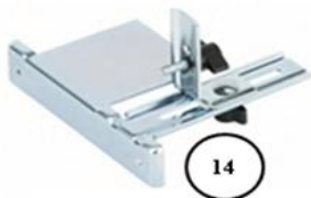
14. Параллельная направляющая