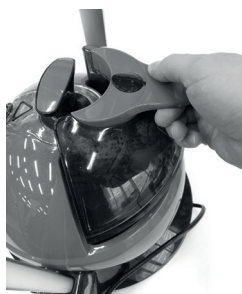
Резервуар для воды

Убедитесь, что прибор отключен от сети. Снимите резервуар с отпаривателя, взяв резервуар за ручку и потянув вверх. Откройте крышку и залейте воду, затем закройте крышку и установите резервуар обратно.