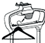
Держатель для плечиков

Наденьте ворсовую щетку-зажим . Для этого вставьте ее в паз на утюжке как показано на рисунке. Вы можете использовать ее, чтобы счищать шерсть с отпариваемых вещей. С помощью зажима вы можете прогладить стрелки на брюках.