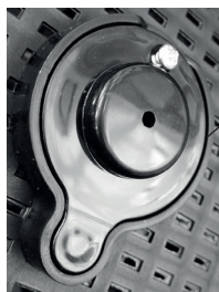
Крышка сливной пробки