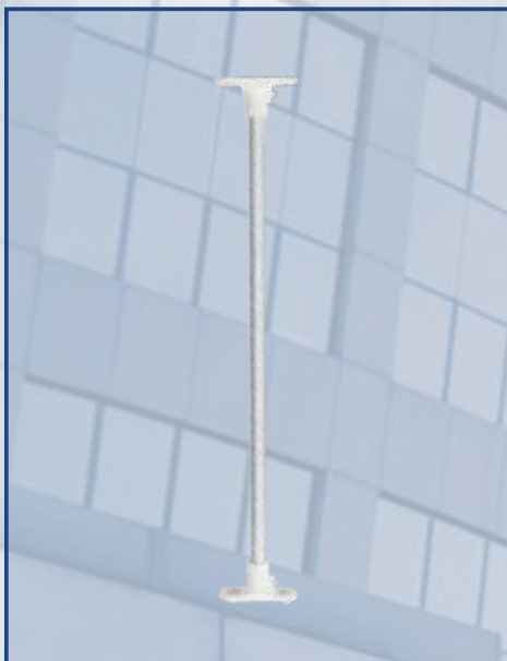
«ТРУБКА» К ПОТОЛКУ

ДЛЯ ПОДВЕСНЫХ ОДНОСТОРОННИХ И ДВУХСТОРОННИХ ТАБЛО ТОПАЗ