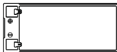
F2 (FASTON TAB 250)