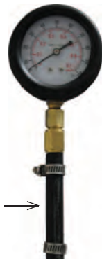
Рисунок 2.3. VW® соединение.

Для подключения напря- мую к тестовому выходу на двигателе.