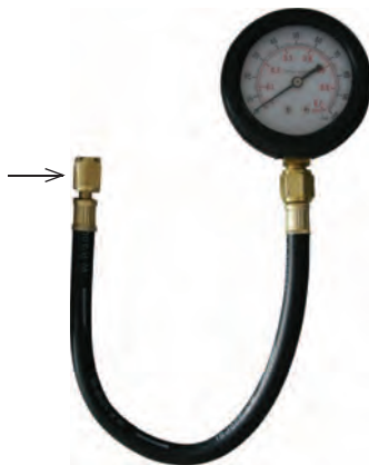
Рисунок 2.4. Cadillac®, Bendix® соединение.

Быстросъемная муфта для тестового фиттинга топливной системы →