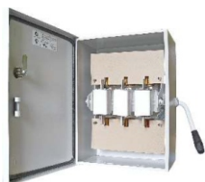
ЯБПВУ - 100 IP 54-009