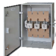
ЯБПВУ - 400 УЗ IP 31, 54