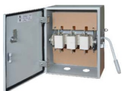
ЯБПВУ - 100 УЗ-003(004) IP 54

Имеется возможность блокировки дверки. Также можно дополнительно заблокировать рукоятку от оперирования висячим замком.