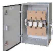
ЯБПВУ - 250 УЗ IP 31, 54