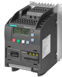
Иллюстрация аналогичная / Figure similar