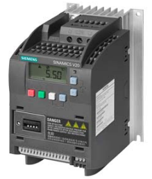
Иллюстрация аналогичная / Figure similar