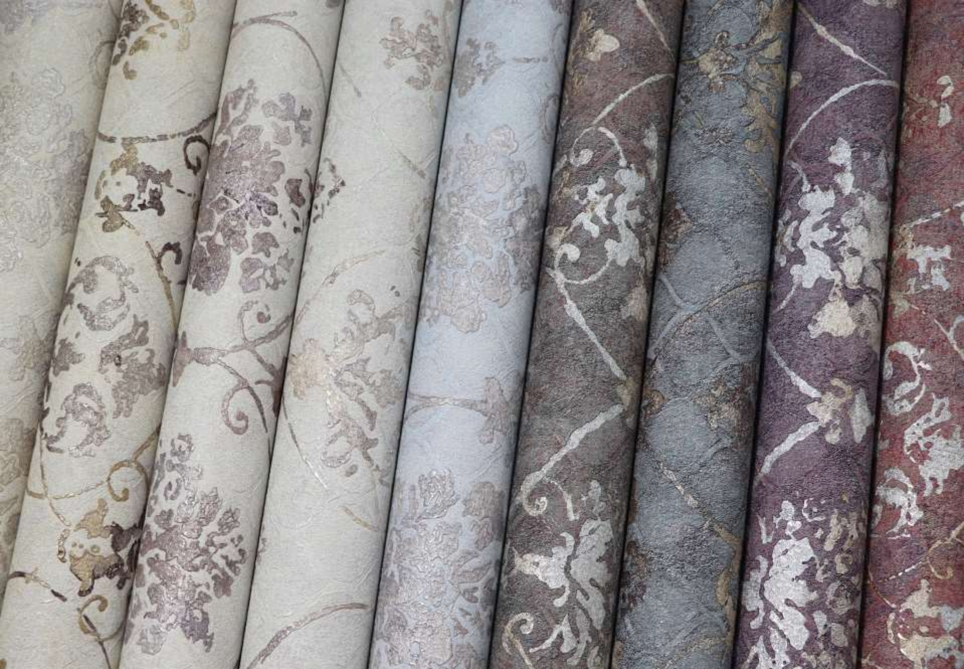
Дизайн выполнен в 9 цветовых вариантах.