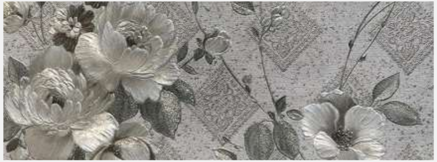
Монохромная палитра серо-кварцевых оттенков, в которой на первый план выступает золотой шиммер.