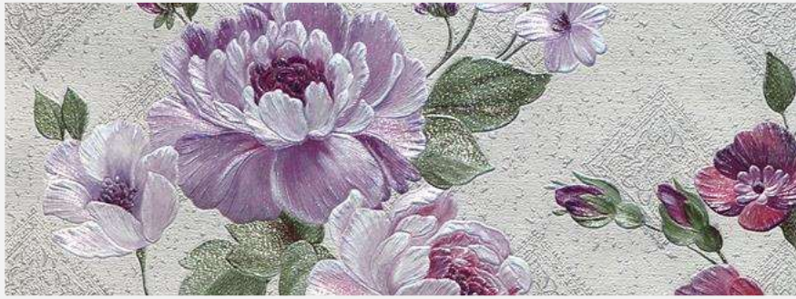
Лилово-фиолетовые оттенки на дымчато-зеленой основе.