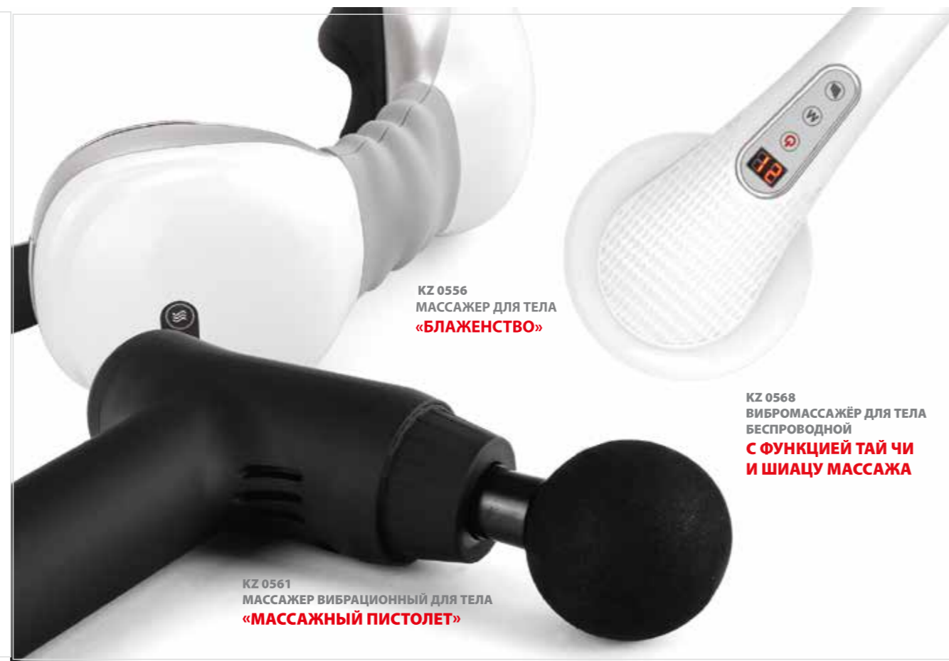
KZ 0556 МАССАЖЕР ДЛЯ ТЕЛА «БЛАЖЕНСТВО»