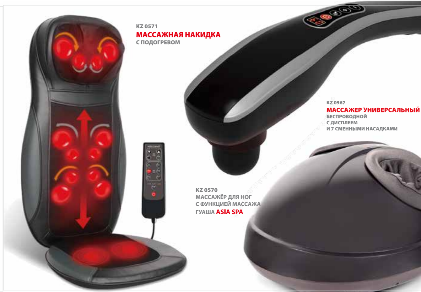
KZ 0571 МАССАЖНАЯ НАКИДКА С ПОДОГРЕВОМ