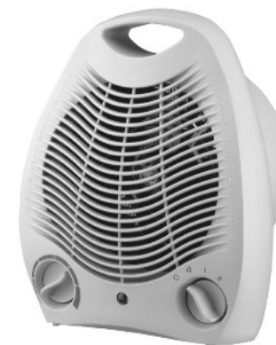
Модель FFH 2010 TC