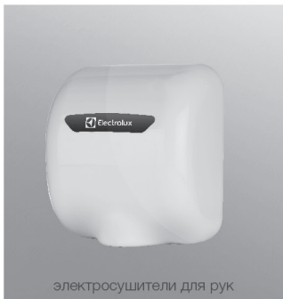
электросушители для рук