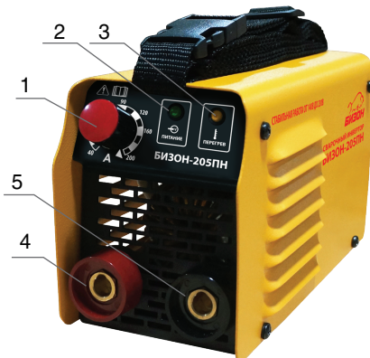
Рис.1. Общий вид.

Работа инвертора основана на принципе фазового сдвига напряжения (инверсии). Переменный ток промышленной частоты (50 Гц) подается на высокочастотный выпрямитель, а затем – на низкочастотный фильтр. В дальнейшем полученный постоянный ток преобразуется коммутированным инвертором на IGBT-транзисторах в ток высокой частоты. Ток высокой частоты подается на силовой трансформатор, который в свою очередь выдает необходимую для сварки мощность. Вторичный выпрямитель преобразует переменное напряжение высокой частоты, соответствующее величине сварочного напряжения, в постоянное напряжение со сглаживанием пульсаций тока. Плата управления осуществляет связь между выходным и входным каскадами, позволяя тем самым регулировать параметры сварочного тока на выходе аппарата. На рис.1. представлен общий вид инвертора.