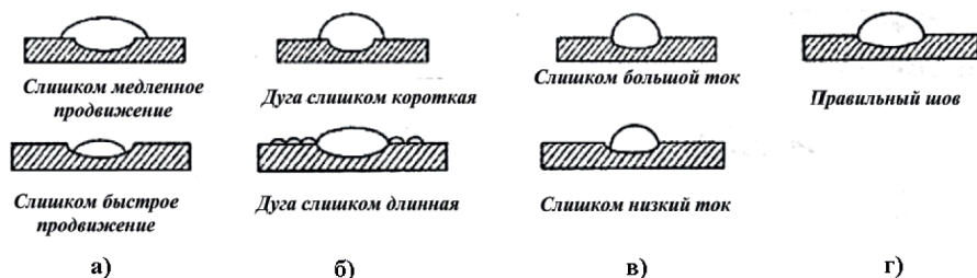
Рис. 3. Типы сварочных швов.

7.7. При правильном выборе скорости сварки и силы тока шов получается необходимой ширины без деформаций и кратеров, см. рис.3г.