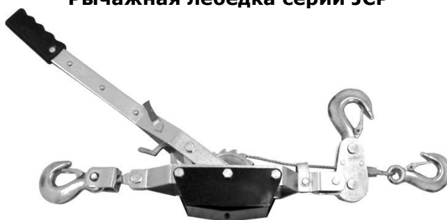
Рычажная лебедка серии JCP

BMX Тул Груп АГ (WMH Tool Group AG) Банштрассе 24, CH-8603 Шверценбах