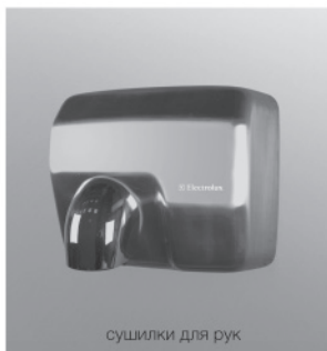
сушилки для рук