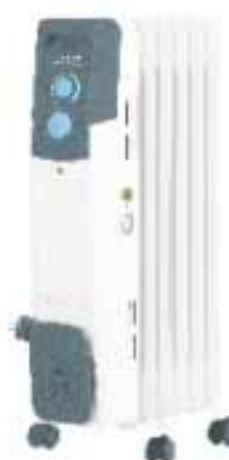
TOR 21... BT I