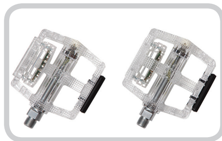
Педали со светодиодами