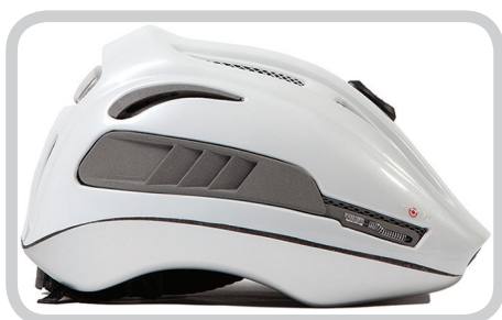
Велошлем со светодиодами

Наиболее полный перечень аксессуаров для безопасного движения представлен на сайте: www.eltreco.ru .