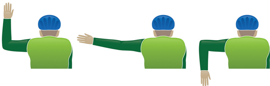
Подача предупредительных сигналов (вид сзади)

- перед совершением маневра, а также перед торможением в условиях движения по дорогам общего пользования подавайте сигналы рукой. Сигналу левого поворота (разворота) соответствует вытянутая в сторону левая рука либо правая, вытянутая в сторону и согнутая в локте под прямым углом вверх. Сигналу правого поворота соответствует вытянутая в сторону правая рука либо левая, вытянутая в сторону и согнутая в локте под прямым углом вверх. Сигнал торможения подается поднятой вверх левой или правой рукой.